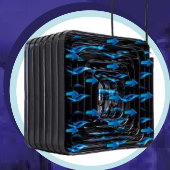
Condensador de bajo mantenimiento