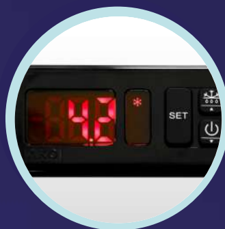
Control electrónico de temperatura