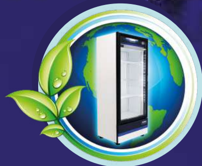
Bajo consumo de energía

Ahorra energía y protege al medio ambiente con refrigerante R-290